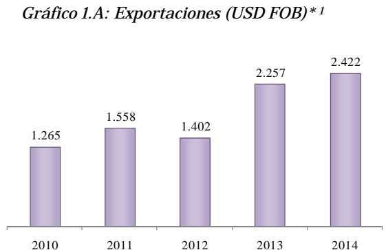
Gráfico 1.A: Exportaciones (USD FOB)* 1